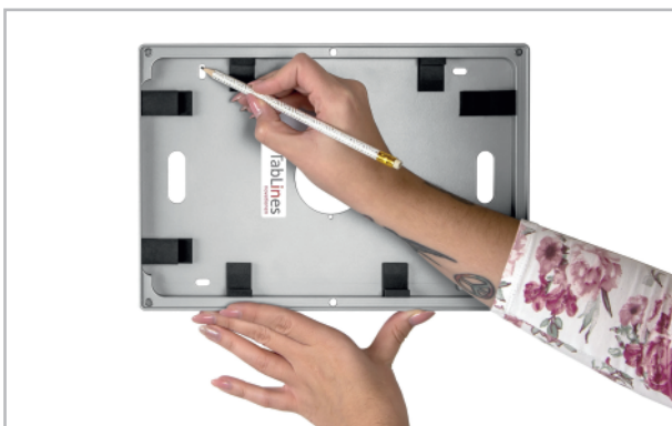
Abb. 2: Löcher markieren & bohren