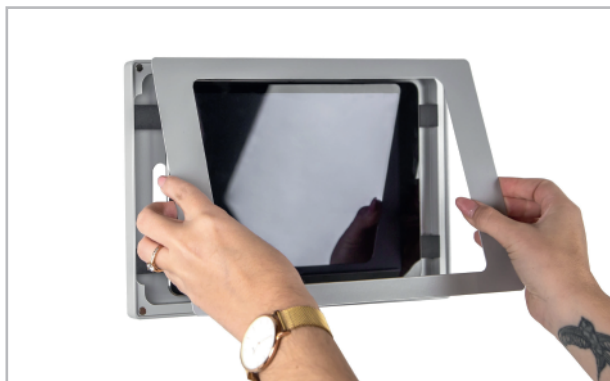
Abb. 5: Gehäuse schließen