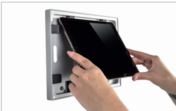
Abb. 4: Tablet einsetzen