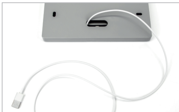
Abb. 6: Optionale Kabelführung