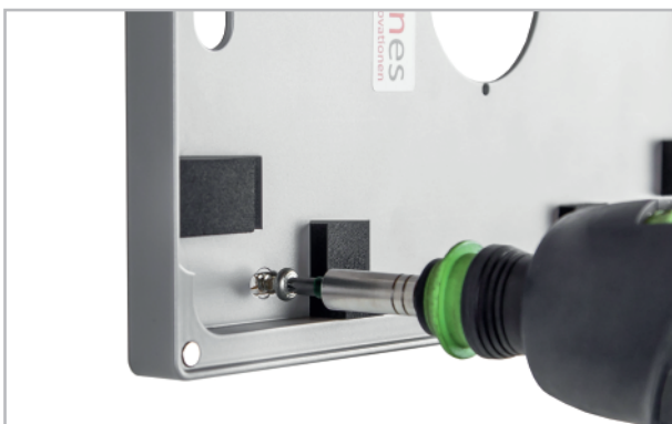
Abb. 3: Befestigung des Tablethalters