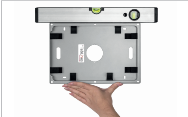
Abb. 1: Gehäuse an der Wand ausrichten