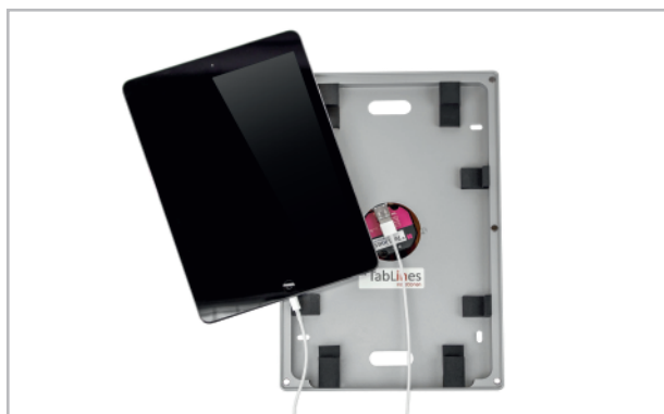
Abb. 7: Optionale Stromversorgung

Für den Fall, dass Sie Ihr TWH direkt über einer Steckdose anbringen möchten, kann das Ladekabel durch die vorgesehenen Öffnungen in dem Gehäuse rausgeführt werden. In dem Fall müssen Abstandshalter zwischen Wand und Gehäuse angebracht werden. Abstandshalter sind nach Absprache im Lieferumfang enthalten.