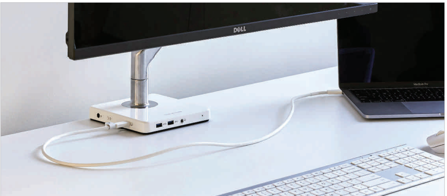
Integrierte Dockingstation: M/Connect 2