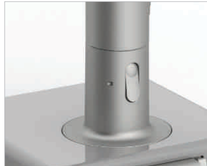
Schnell lösbare Verbindungen