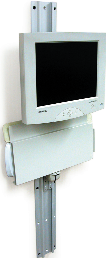
PIVOT MOUNTED TO WALL TRACK. WALL TRACK CAN PROVIDE A COMMON INTERFACE FOR MULTIPLE PIVOTS