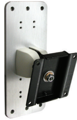
SINGLE PIVOT MOUNTED TO WALL PLATE