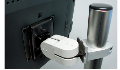
MOUNTED TO 2" ROUND POLE