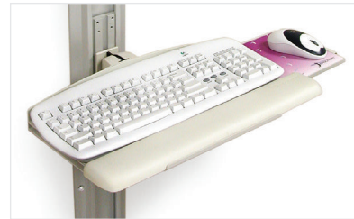
KEYBOARD PIVOT WITH KEYBOARD TRAY—FOLDS UP AT WHEN NOT IN USE